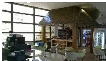
De Koffiecorner en Toko

In augustus 2016 is de cliëntenraad om advies gevraagd in verband met de verbouwing van de entree. Met de Pasar Malam in juni 2017 vond de officiële opening van de nieuwe entree plaats. Onder het motto “Warm welkom DE” worden bezoekers warm en vriendelijk ontvangen. Naast verplaatsing van de toko naar de hal zijn er nieuwe zitjes en is er een doorgang naar de binnenplaats. De doorgang is bekostigd door de Vrienden van Rumah Kita. Bewoners van Rumah Kita zijn inmiddels gewend aan de nieuwe entree en zitten nu vaker in de hal. Er staan nog 2 wensen van de cliëntenraad open: de kleding van de gastvrouwen en de plafondventilator voor in de hal.