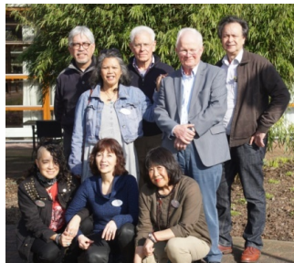
Van links naar rechts op de foto