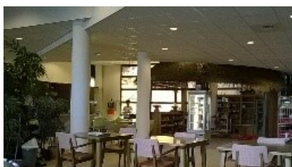
De nieuwe Entree