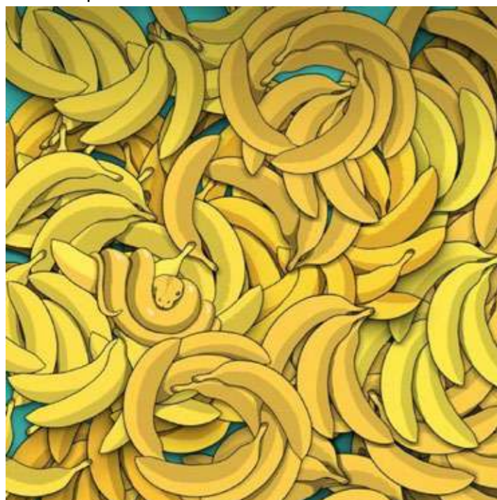
... de slang?