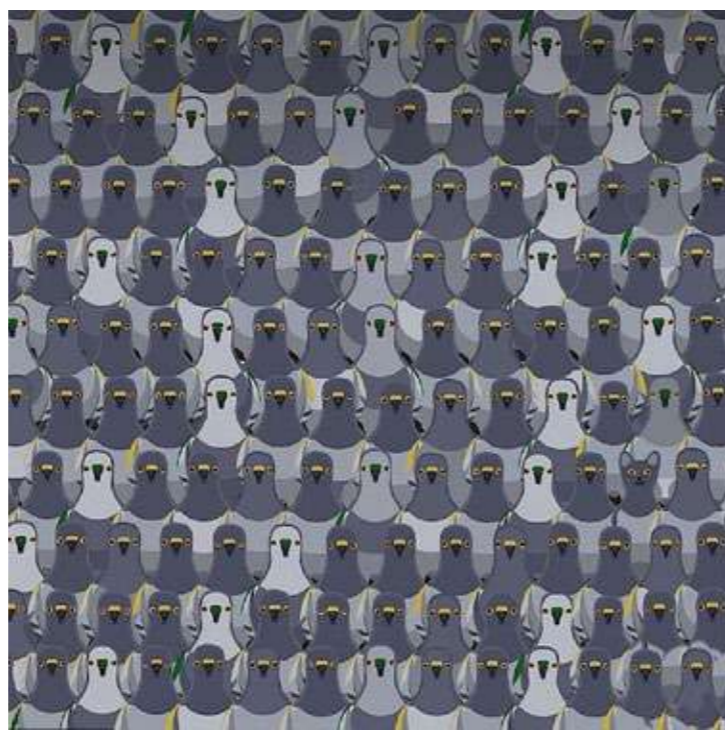
... de kat?