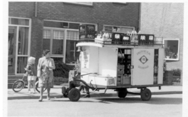
Melkkarretje uit de 50-er jaren

Als ik nu een dieetboekje zie met informatie over een glutenvrij dieet, voel ik nog steeds de pijn van het schrijven van de strafregels in mijn vingers. Hoewel het niet meer denkbaar is dat leerlingen op zaterdagochtend naar school moeten, zijn deze herinneringen nog steeds levendig in mijn gedachten!