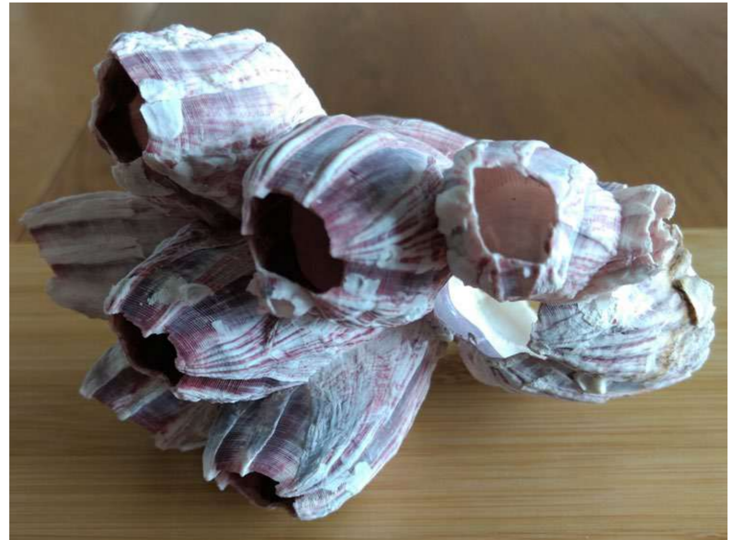
Lisa Pijlman - Visser

Zo hoop ik dat het leven uit de zee weer een beetje tot leven komt in de vitrine van Oranje Nassau's Oord!